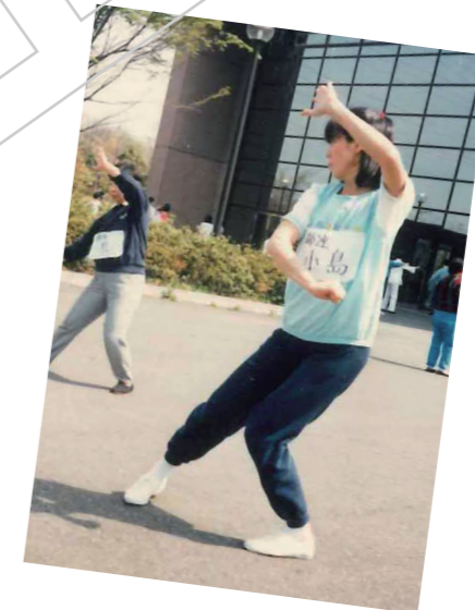
◀ 1987 年 4 月 合宿にて