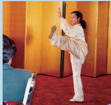
▲ 約 20 年前、母の米寿のお祝いの席で

「身体に良さそう!!これは一生できるぞ」と思い、私は太極拳を始めました。千代田教室では松田先生の準備運動ヨーガのお声が心地よい響きと共に深く心に残っています。文化センターに移り、最初の頃から続けている方々とは長いお付き合いをさせていただいております。ありがたく幸せなことです。100 期を迎える中で微力ながら指導をさせていただき感謝しています。太極拳は健康の源であり宝物になりました。日中文化センターの益々の飛躍を祈念いたします。