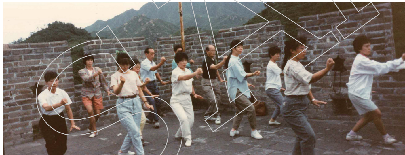
▲1990年 北京 万里の長城にて太極拳

本日はお忙しいところ、貴重なお話を伺うことができました。ありがとうございました。 (2020年11月23日 於：日中文化センター太極拳スペース)