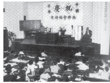
▲日本中国友好協会結成大会 1950年10月1日 東京一ツ橋 教育会館