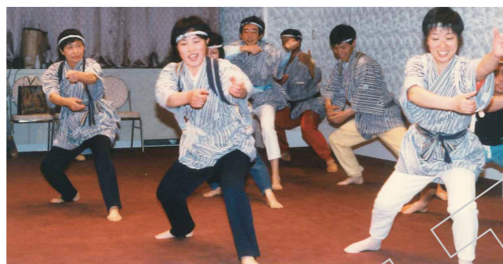
▲1988年4月 都連10周年記念合宿 東京厚生年金サンピア多摩にて

さん。最後の夜、成果発表を畳敷きの大きな部屋で行いました。みんなで枕投げをしたり、布団を投げたりして遊んだのを覚えています。