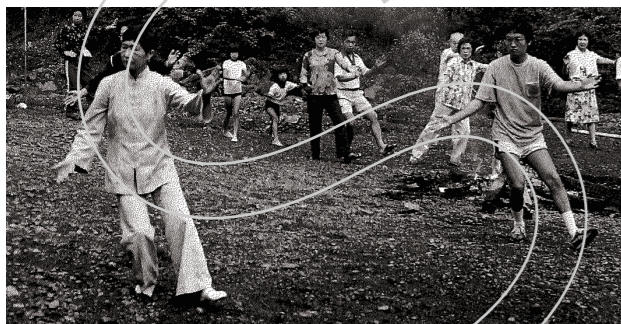
▲第 19 回 日中都連キャンプ (1980.7.26～27)