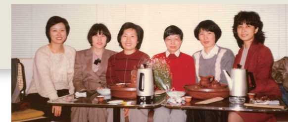
▲松田先生還暦のお祝い

1978年、都連太極拳教室の1期生として太極拳を始める。以後、初期の世田谷、大田教室の指導員を始め、2001年、品川うみなり教室の指導員として現在に至る。