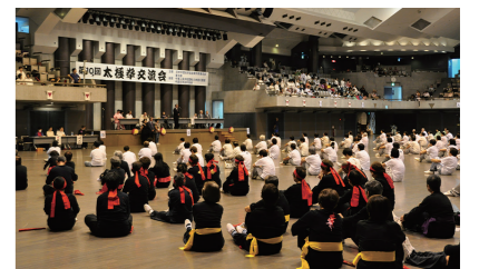
▲2015年9月 第10回交流大会