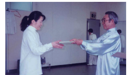
▲ 3 級の認定証書をいただいて嬉しそう。